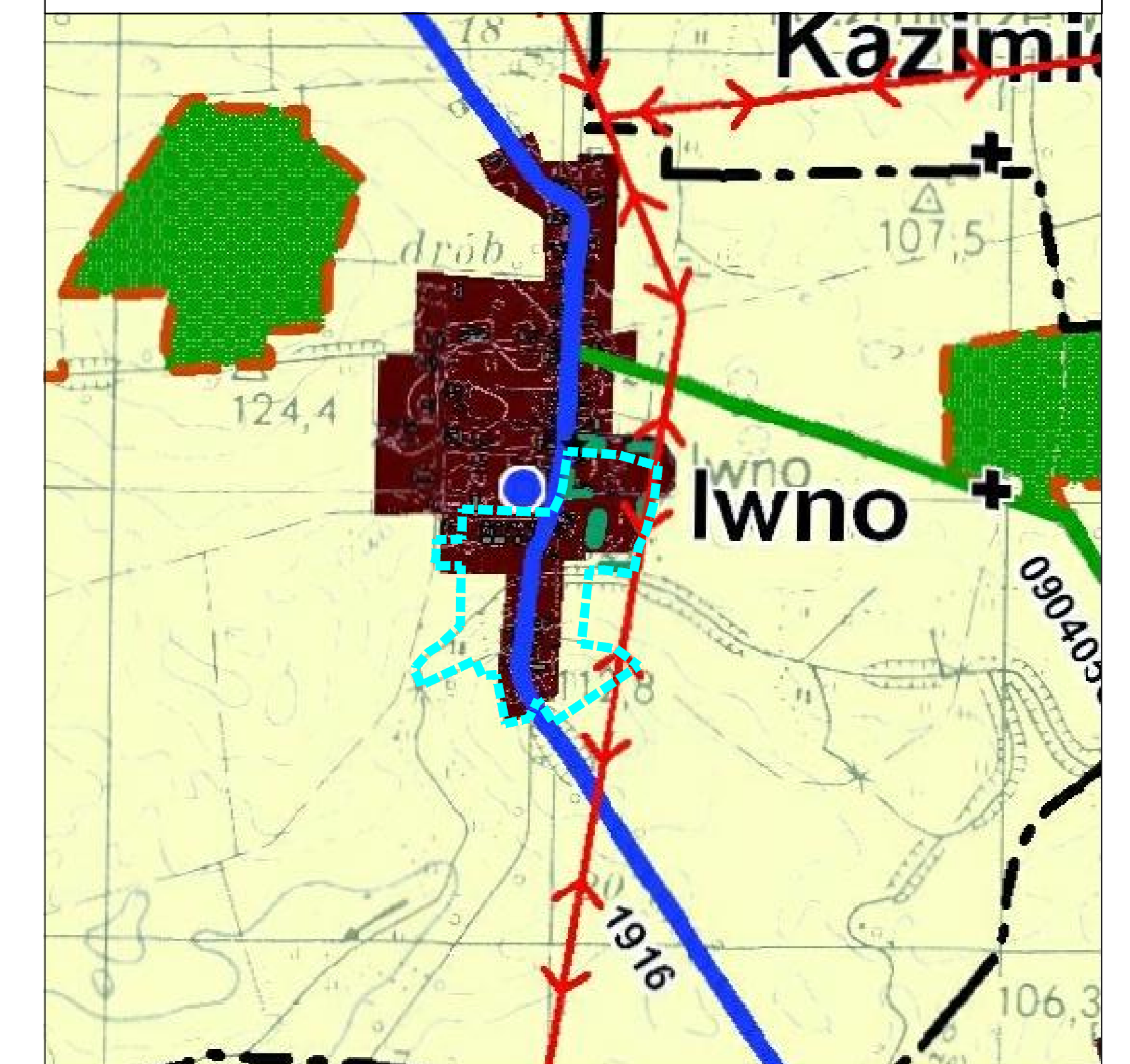
WYRYS ZE STUDIUM UWARUNKOWAŃ I KIERUNKÓW ZAGOSPODAROWANIA PRZESTRZENNEGO GMINY KCYNIA Z OZNACZENIEM GRANIC OBSZARU OBJĘTEGO PLANEM SKALA 1:10 000