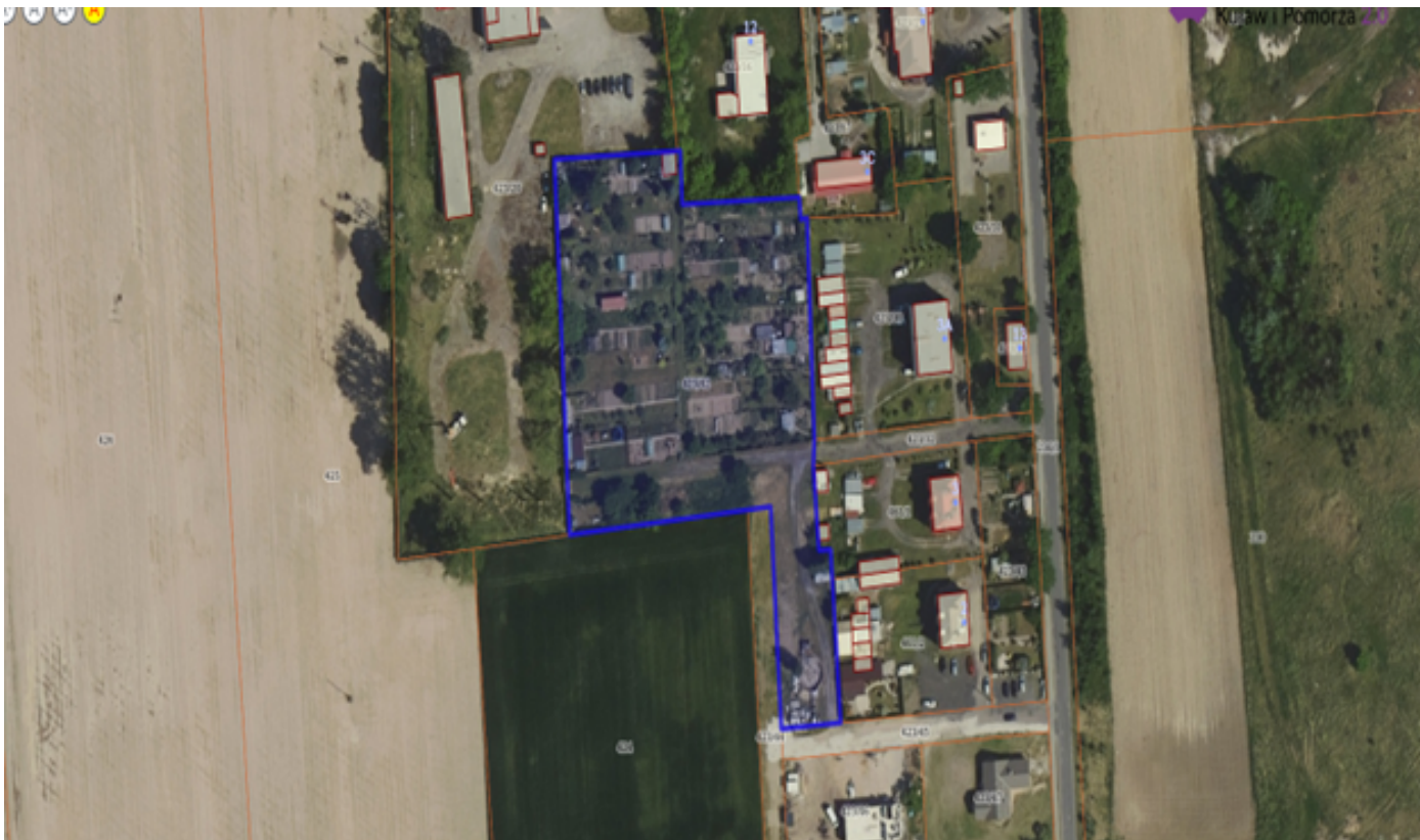
Działka numer 98/3 obręb Dobieszewo.