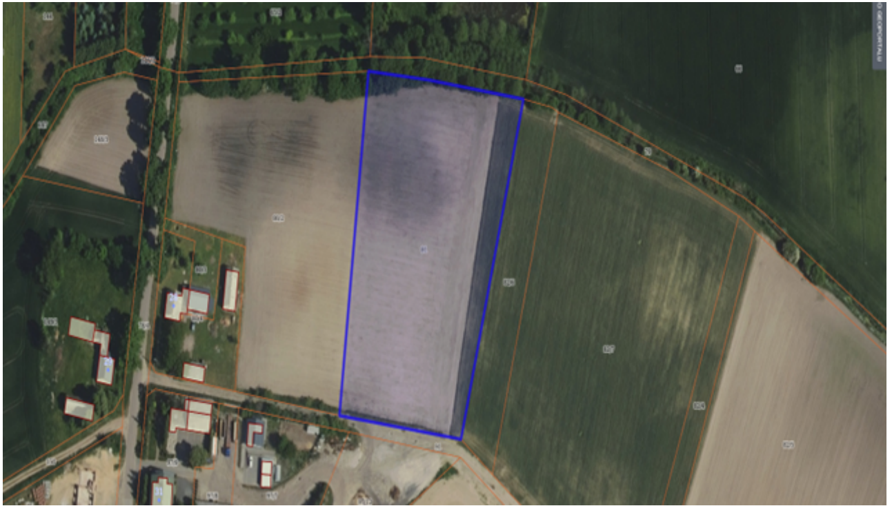
Działka numer 61/2 obręb Słupowa.