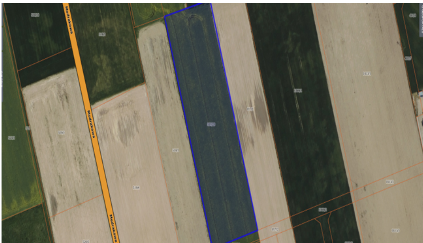
Działka numer 201/2 obręb Żarczyn.