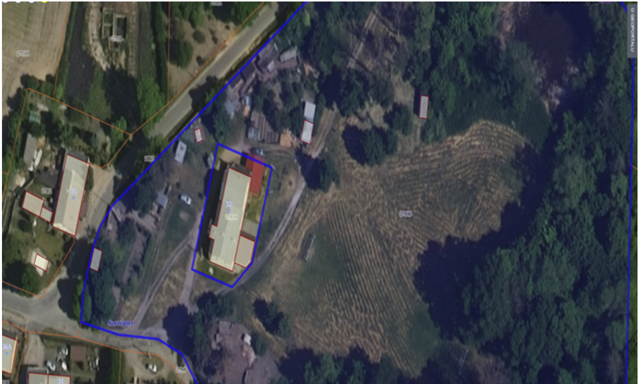
Działka numer 423/42 obręb Karmelita.