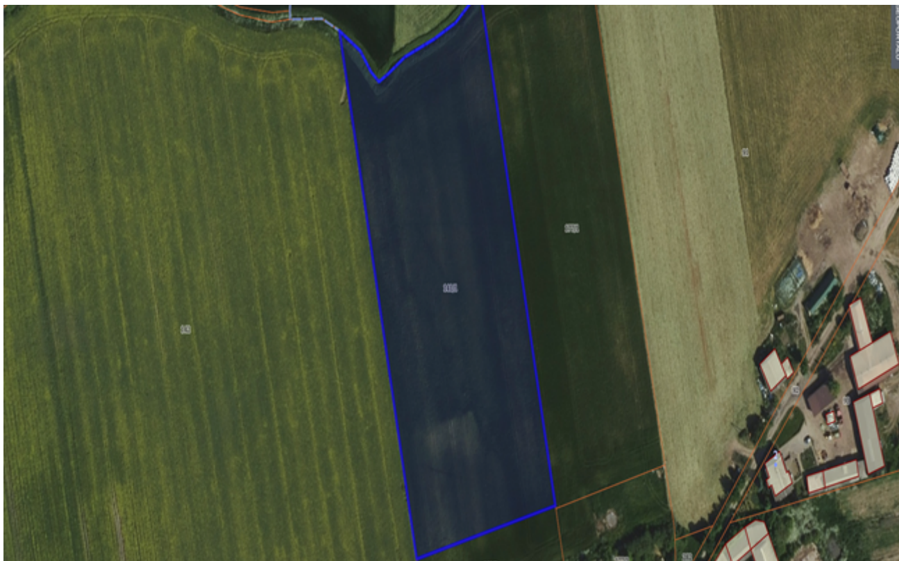
Działka numer 517/29 obręb Kcynia.