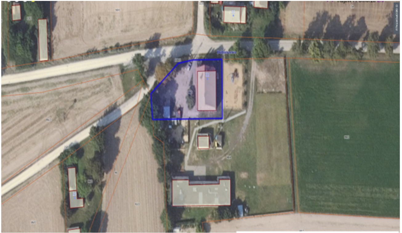
Działka numer 470/3 obręb Kcynia.