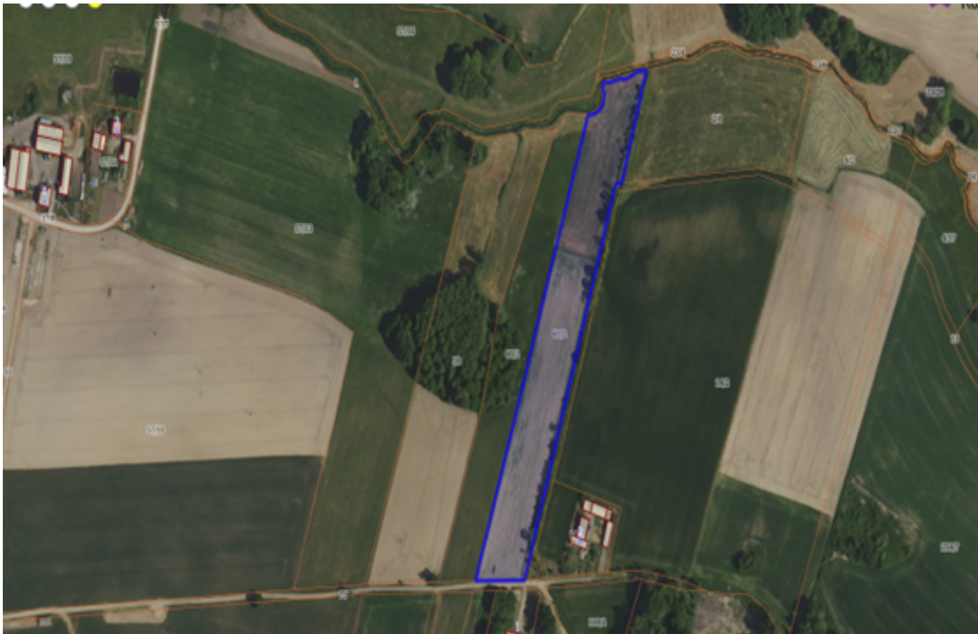
Działka numer 141/1 obręb Turzyn.