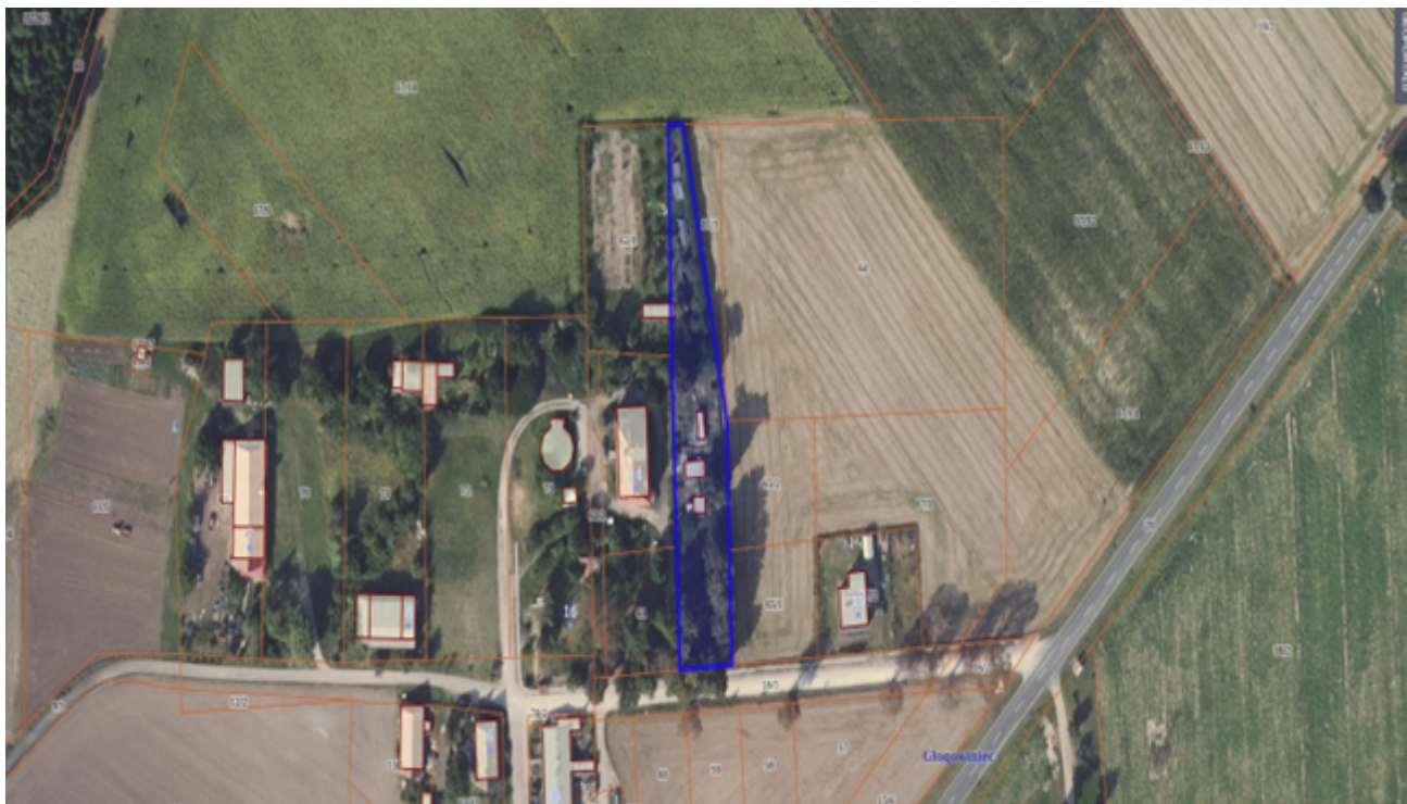
Działka numer 448/1 obręb Piotrowo.