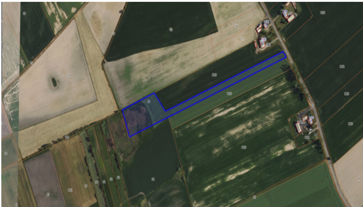
Działka numer 91 obręb Górki Zagajne.