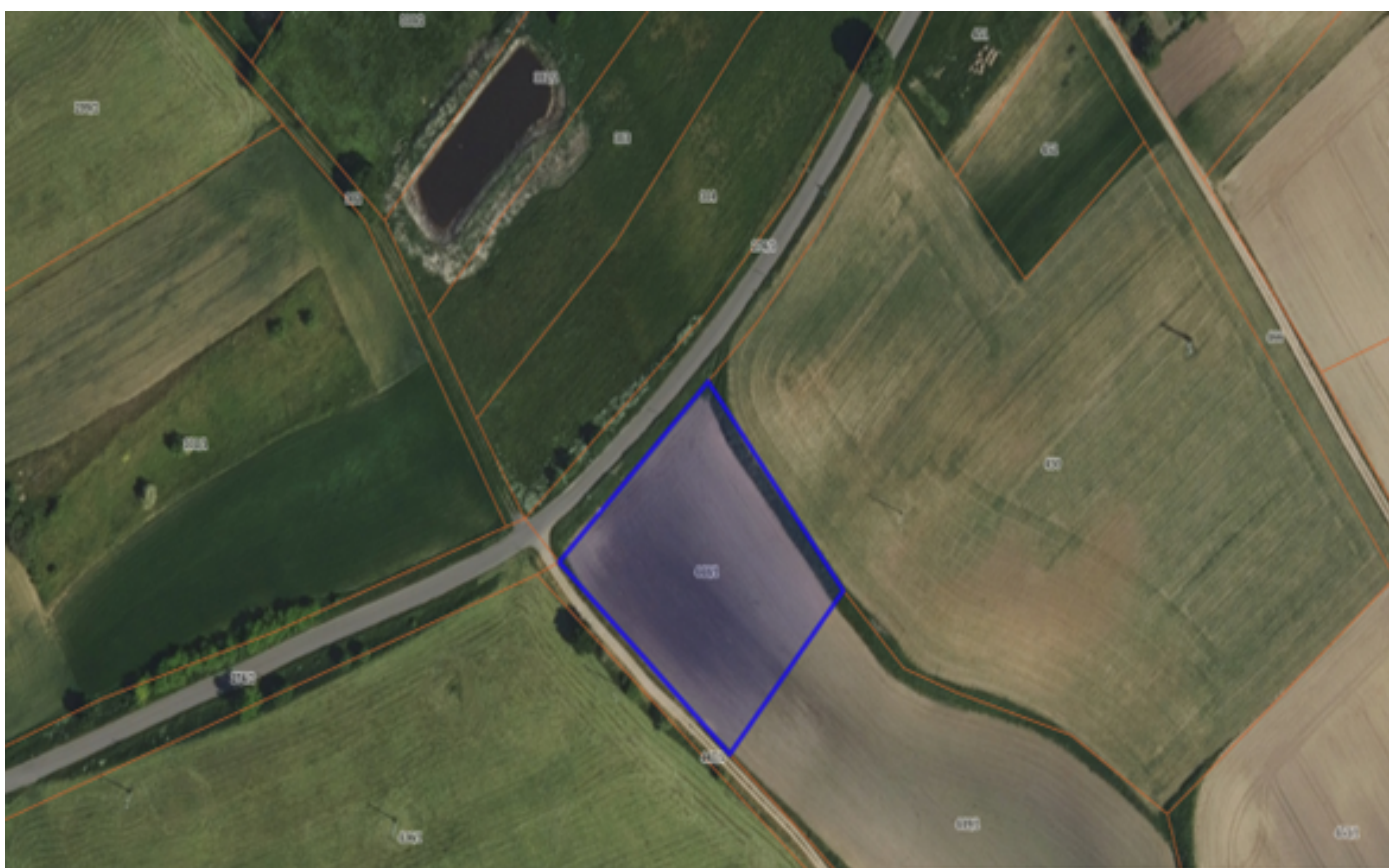
Działka numer 59 obręb Dziewierzewo.