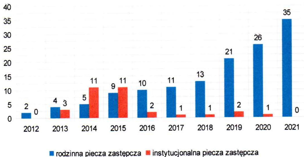
Wykres nr 2: Liczba dzieci umieszczonych w pieczy zastępczej w latach 2012-2021

Źródło: opracowanie własne na podstawie not obciążeniowych z Powiatowego Centrum Pomocy Rodzinie w Nakle nad Notecią