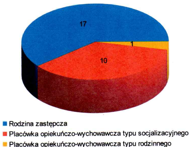
Wykres nr 1: Liczba dzieci umieszczonych w pieczy zastępczej przed 2012 r.

Poniższe wykresy słupkowe przedstawiają liczbę dzieci z gminy Kcynia, które trafiły do pieczy zastępczej od 2012 r. oraz wydatki gminy Kcynia związane z ich pobytem w pieczy.