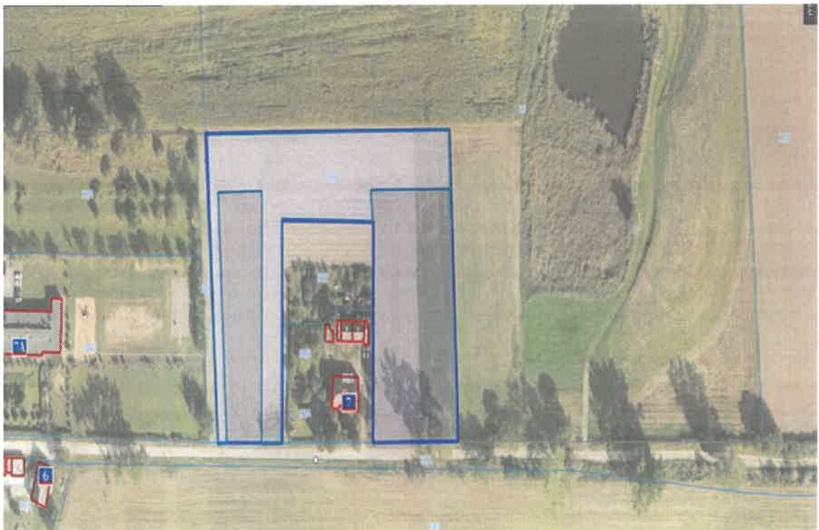
7. Działka numer 318 część Kowalewko