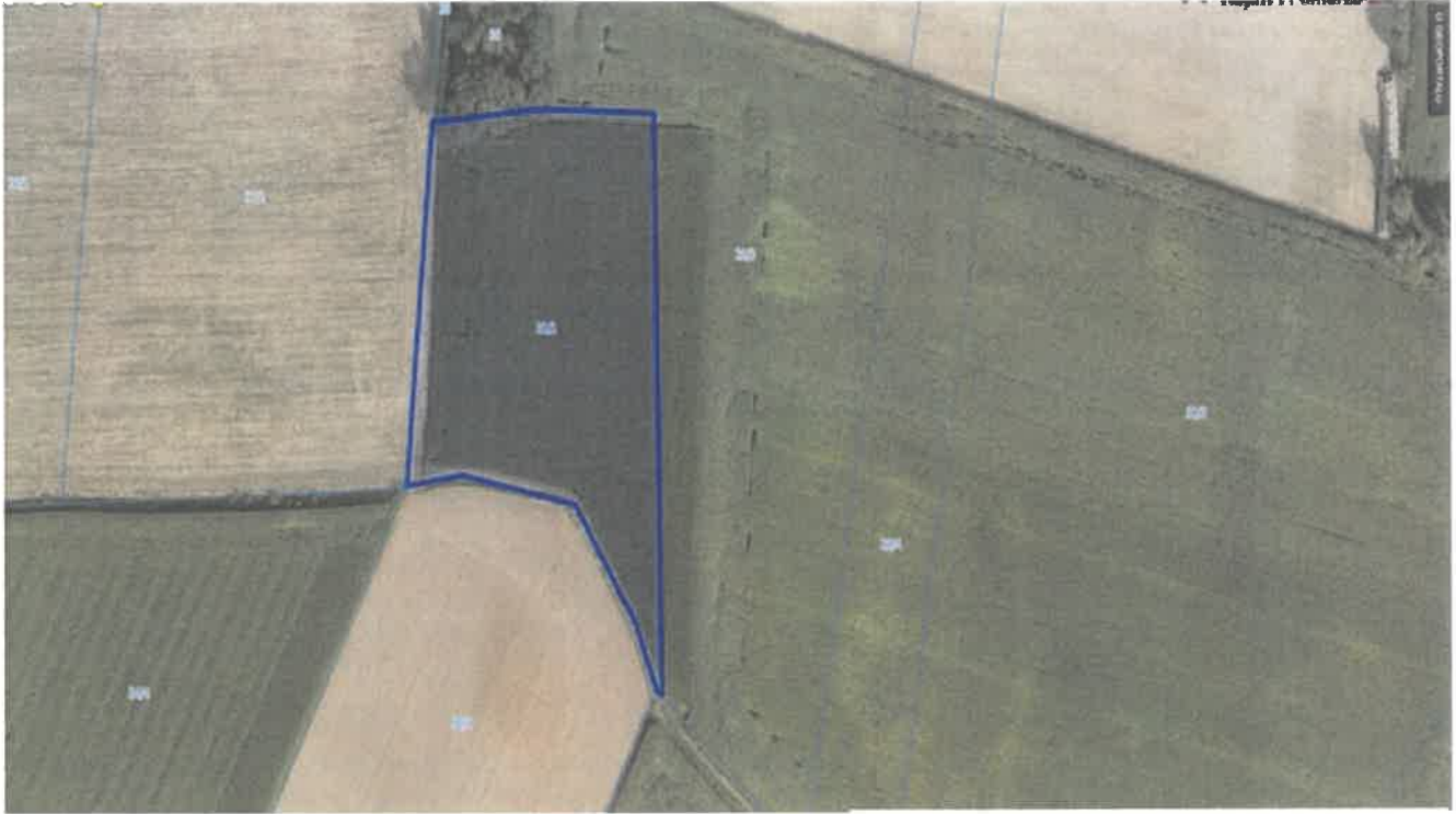
6. Działka numer 31/4 Palmierowo