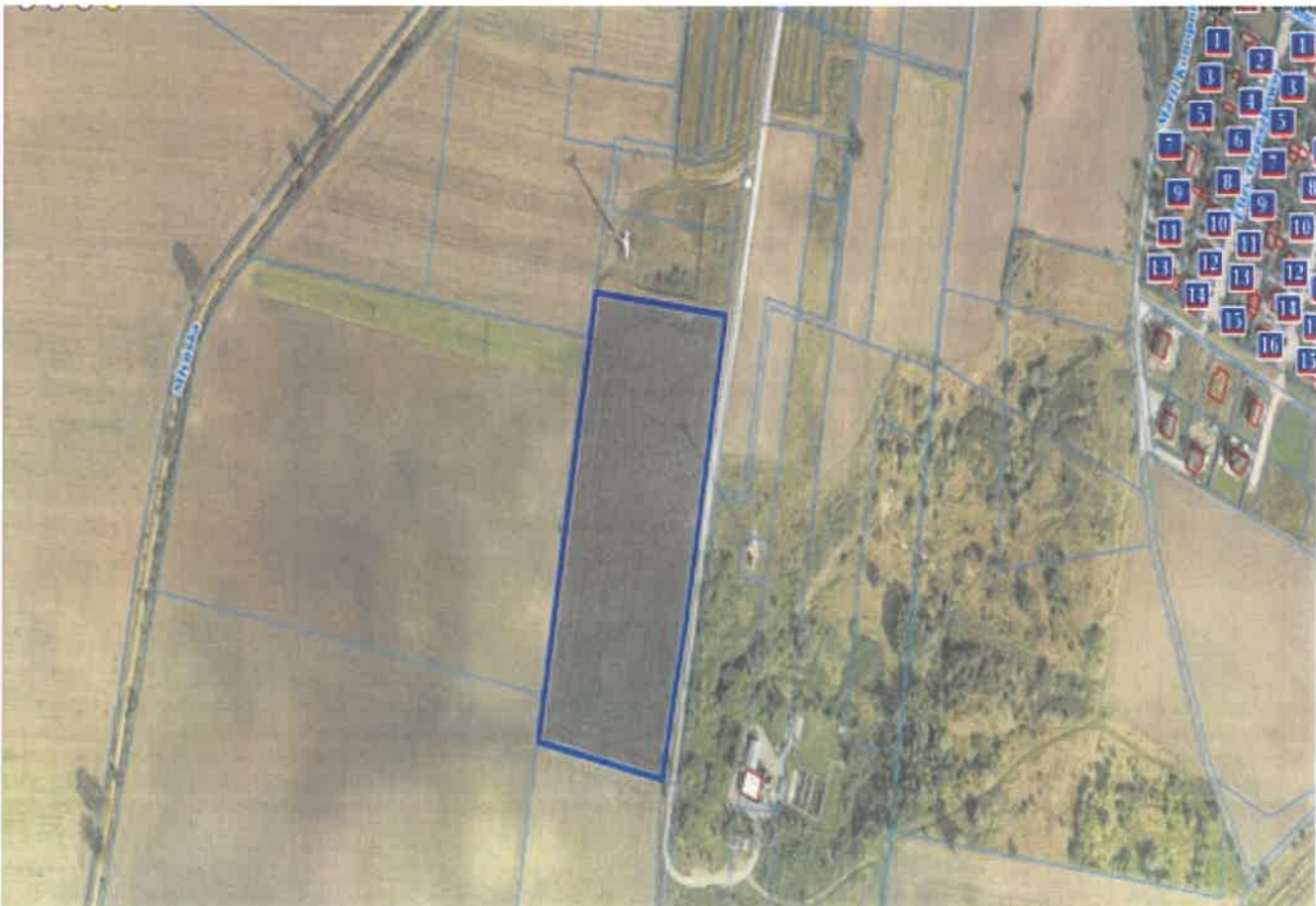
5. Działka numer 31/1 Miaskowo