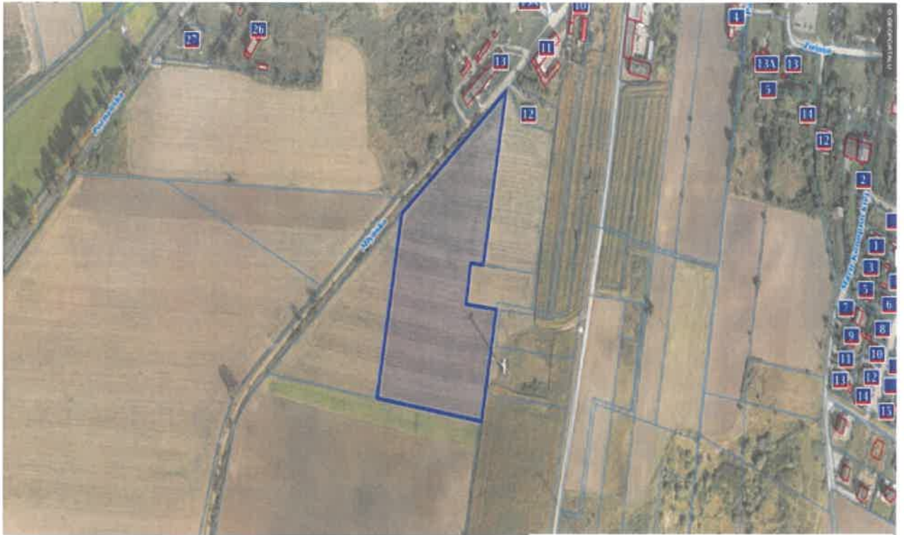
4. Działka numer 662/7 Kcynia ul. Młyńska