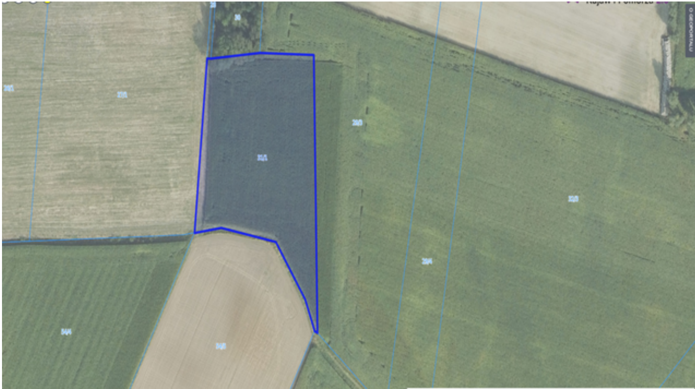
6. Działka numer 31/4 Palmierowo