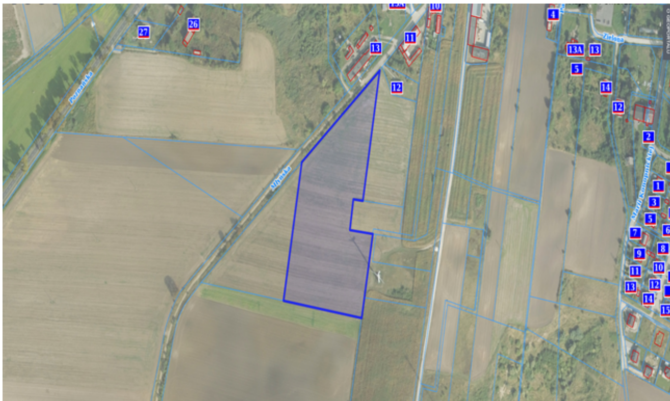
4. Działka numer 662/7 Kcynia ul. Młyńska