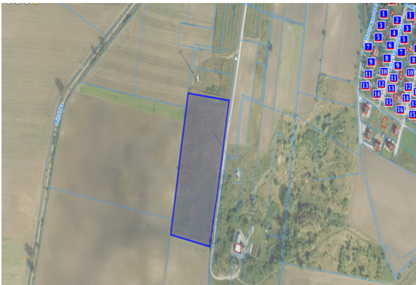
5. Działka numer 31/1 Miaskowo