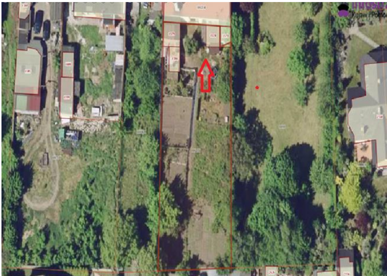
6. Działka numer 423/42 obręb Karmelita.