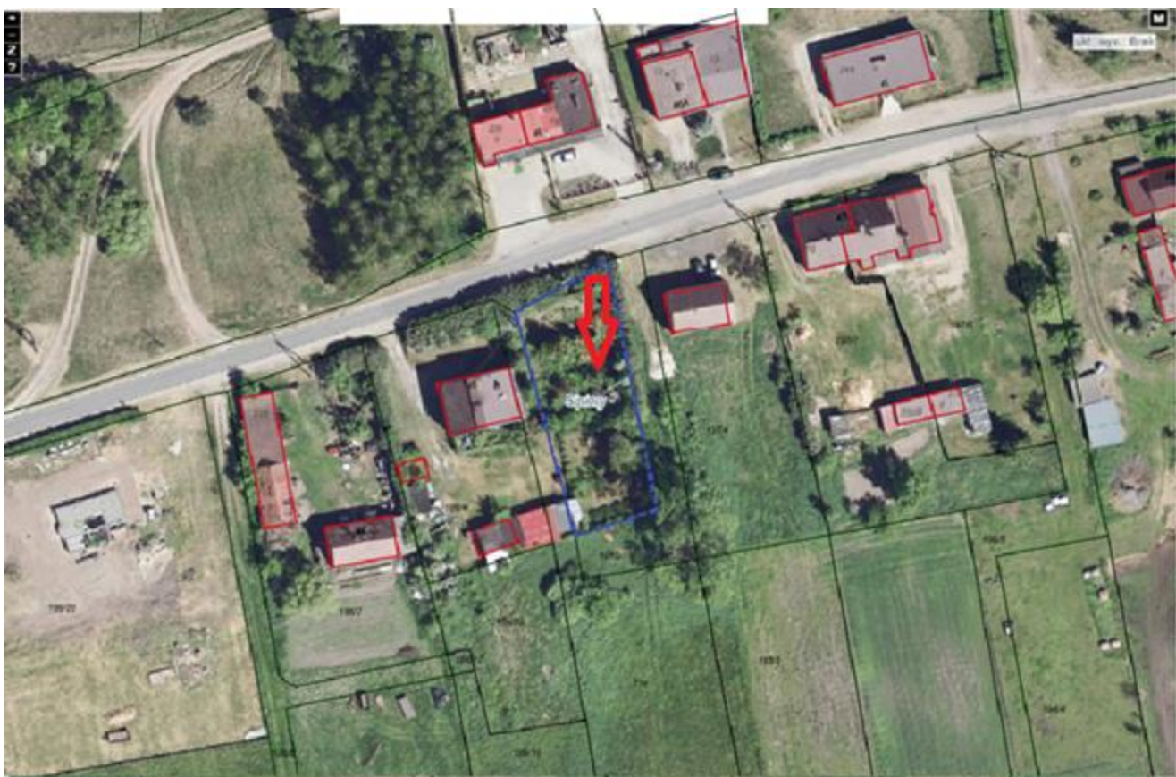
5. Działka numer 1012/5 obręb Kcynia.