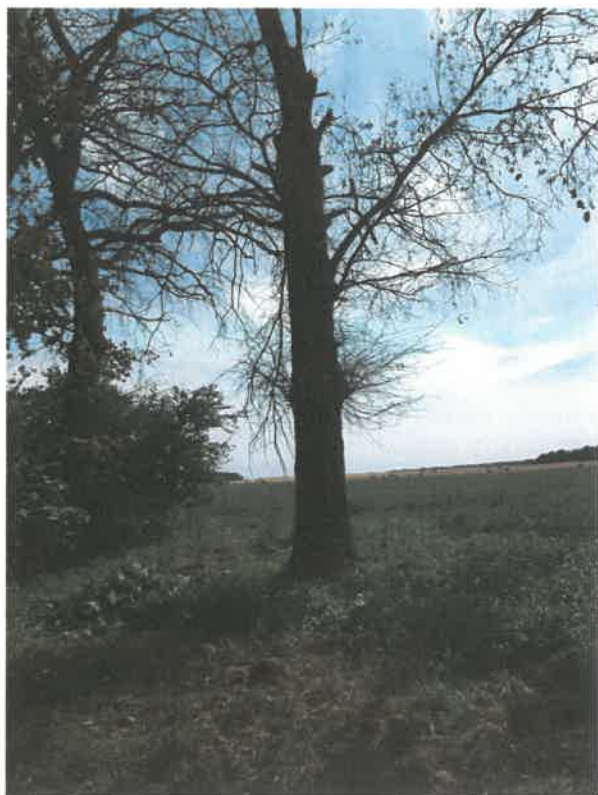
Drzewo nr 1 – Dąb Szypułkowy – obwód 210 cm