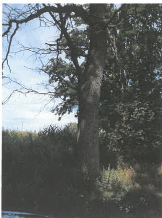
Drzewo nr 2 – Dąb szypułkowy – obwód 250 cm