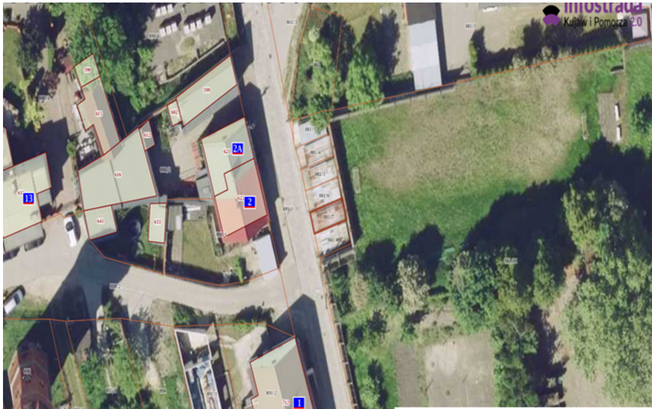
8) Działka numer 881/8 Kcynia ul. Klasztorna