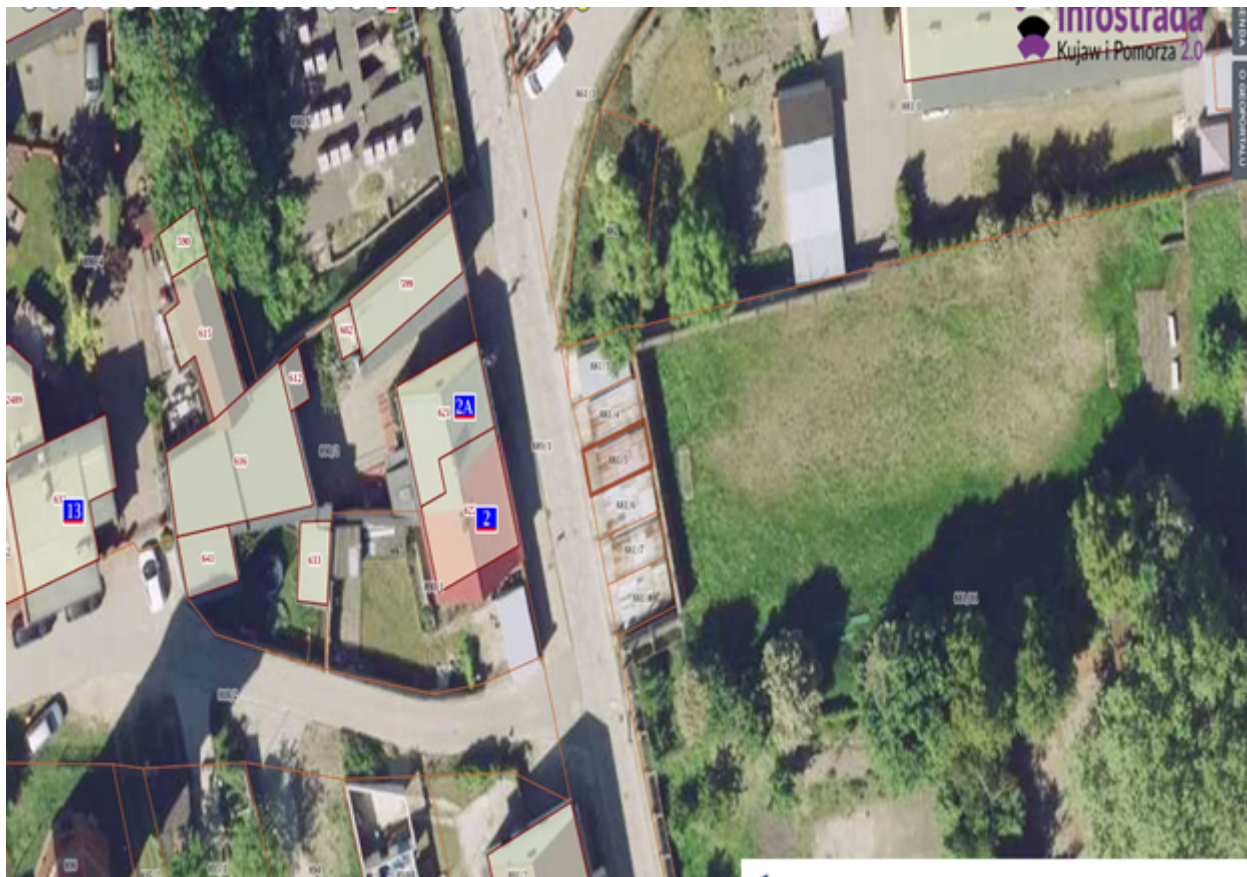
6) Działka numer 881/6 Kcynia ul. Klasztorna