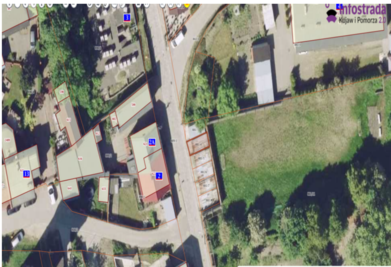
5) Działka numer 881/5 Kcynia ul. Klasztorna