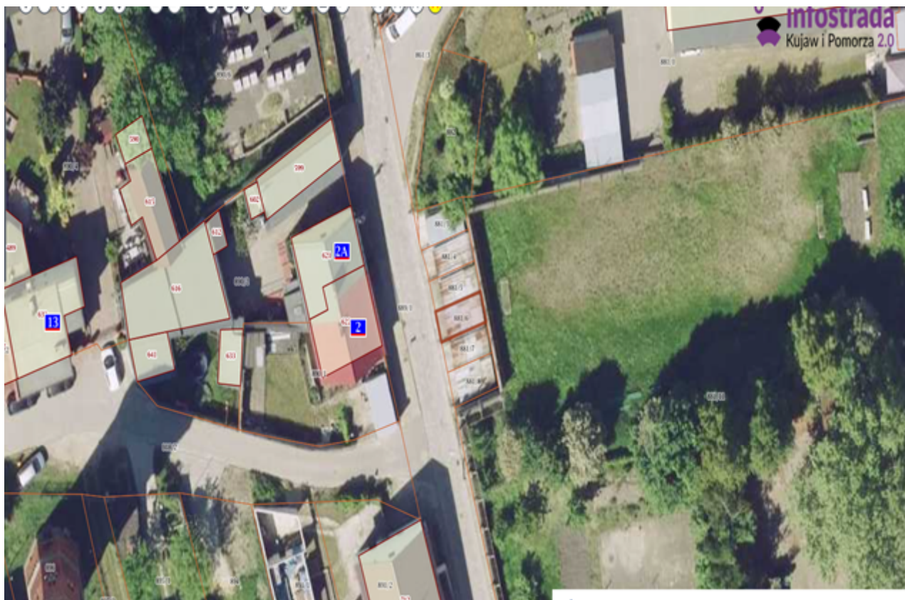
7) Działka numer 881/7 Kcynia ul. Klasztorna