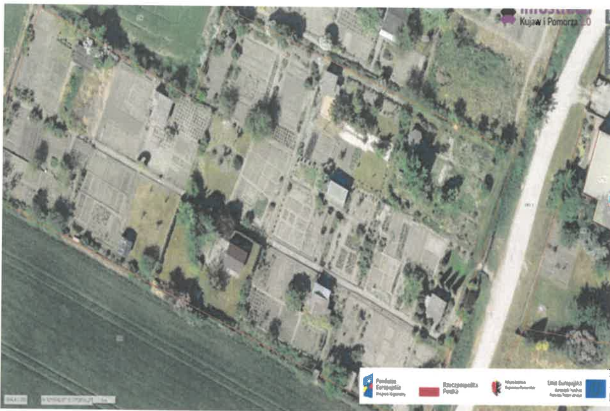
4) Działka numer 186/18 Sipiory